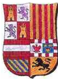
Ayuntamiento de Checa