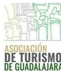
Asociación de Turismo de Guadalajara