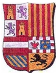
Ayuntamiento de Checa