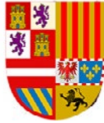
Ayuntamiento de Checa